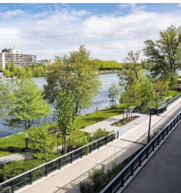
Le quai de Clichy réaménagé le long de la RD1.